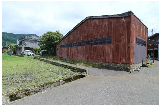
進入路（玄関前に1台駐車可能）